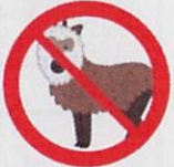
動物(介助犬を除く)